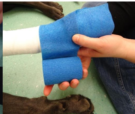
12. Die letzte Lage besteht aus elastischen, selbstklebenden Binden. Diese wieder von distal nach proximal und von außen nach innen anbringen.