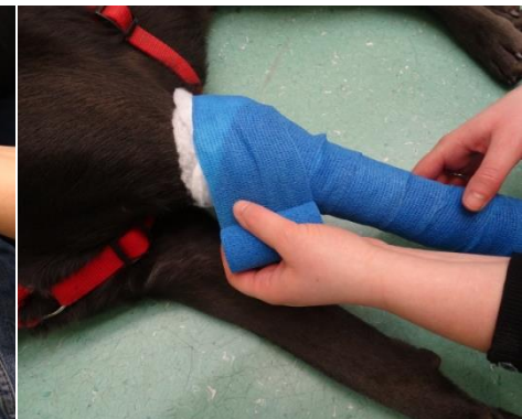
13. Am oberen Rand lassen Sie die Polsterwatte etwas heraushängen, um ein Einschnüren zu verhindern.