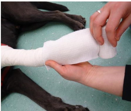
9. Als 2. Lage die Mullbinde als Abdeckmaterial anbringen. Auch hier von außen nach innen und von distal nach proximal wickeln und nicht über die Watte hinaus wickeln.