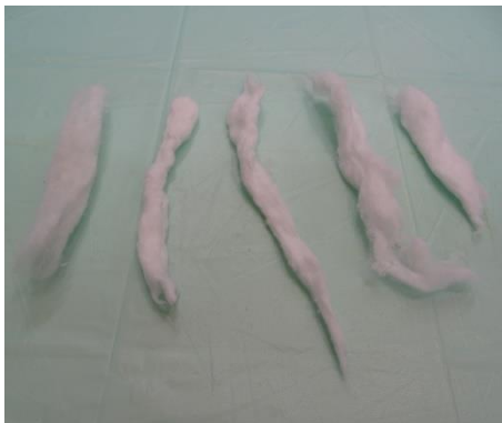
4. Aus der Polsterwatte 5 Streifen herausreißen. Sie dienen später zum Polstern des Zwischenzehenbereiches.