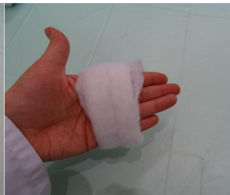
2. Ein Stück der Polsterwatte um die Hand wickeln, damit ein „Donut“ aus Watte entsteht.