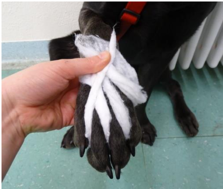
1. Polsterung des Zwischenzehenbereiches mit den vorbereiteten Wattestreifen.

Achten Sie beim Anlegen auf eine ausreichende Polsterung und einen straffen, nicht abschnürenden Sitz.