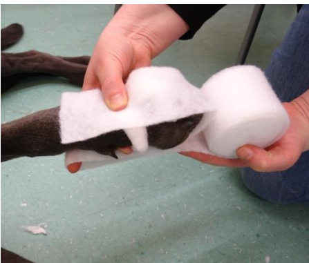
4. Umschlagen des Polsters unter der Pfote.