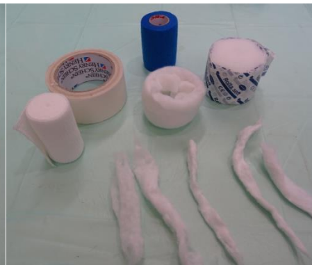
5. Übersicht über alle Materialien