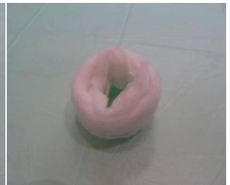
3. Fertiger „Donut“. Er dient später zum Abpolstern des Olekranons