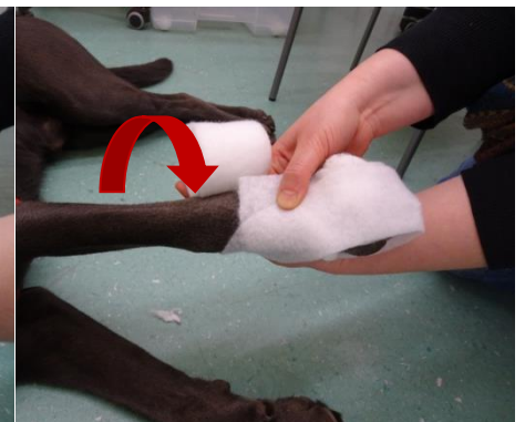
...und von außen nach innen .