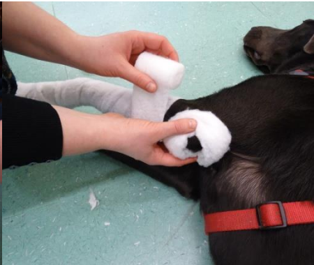
7. Das Olekranon mit dem vorbereiteten „Donut“ aus Watte polstern. Dabei darauf achten, dass das Polstermaterial am Bein die gleiche Höhe hat, wie das Polster des Olekranons.