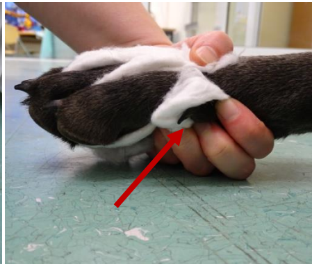
2. Daumenkrallen und wenn vorhanden auch Wolfskralle mit polstern!