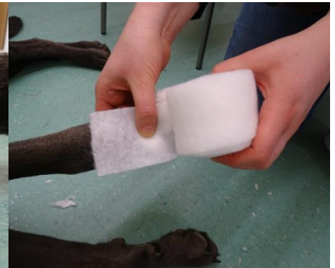
3. Abdecken der Pfote mit Polstermaterial.