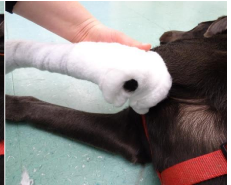
8. Die Polsterwatte bis proximal des Ellenbogens wickeln.