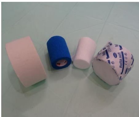
1. Material: Klebeband, selbstklebende Fixierbinde, Mullbinde, Polsterwatte, Krepppapier