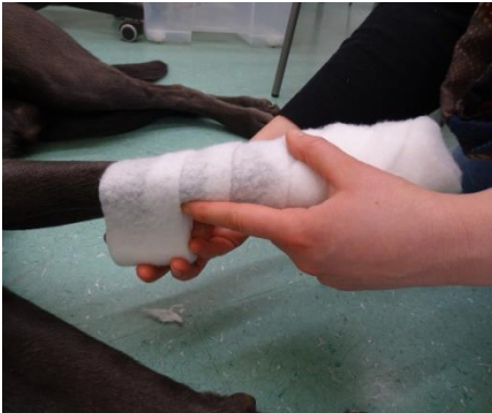
6. Wickeln der Watte bis distal des Olekranons.