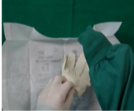
11. Verfahren Sie in gleicher Weise mit dem rechten Handschuh.