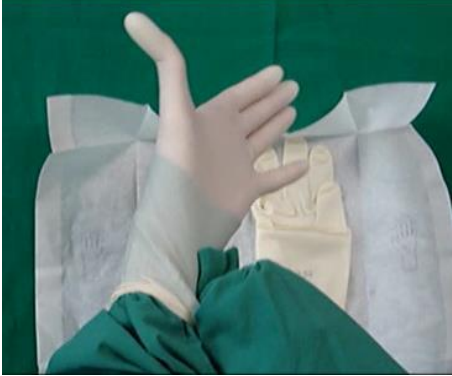
10. Richten Sie Handschuh und Kittel.