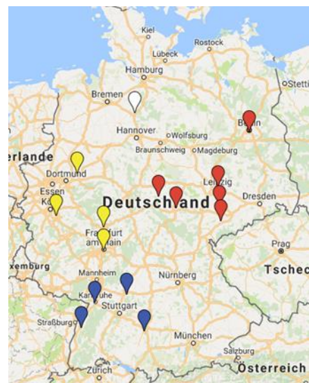
Abb. 4: Übersichtskarten der Standorte der im Jahr 2016 besuchter Vogelbörsen (links) und Terraristikbörsen (rechts)