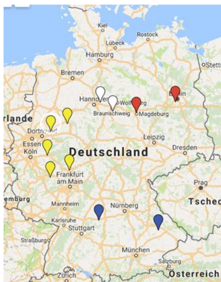
Standorte der besuchten Vogelbörsen