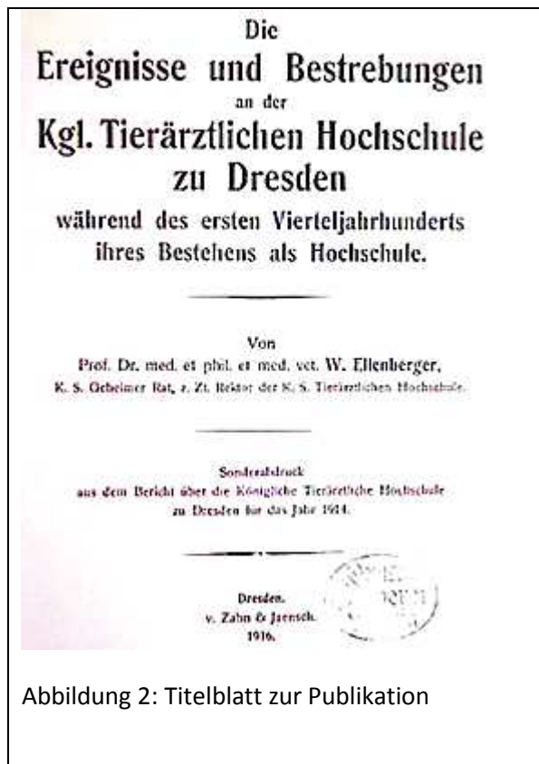
Abbildung 2: Titelblatt zur Publikation