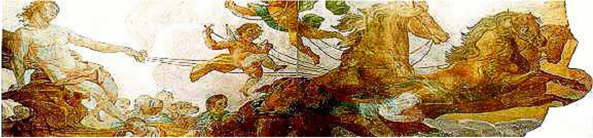
Teilansicht des Deckenfresko "Helios im Sonnenwagen", einst im Paradesaal des Auerbachs Hofes, heute im Geschäft am Ausgang der Mädlerpassage/Neumarkt 14 in Leipzig.