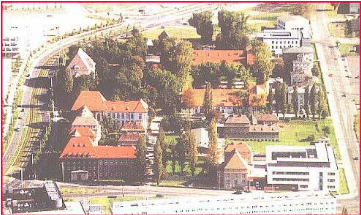
Die Veterinärmedizinische Fakultät der Universität Leipzig 2005