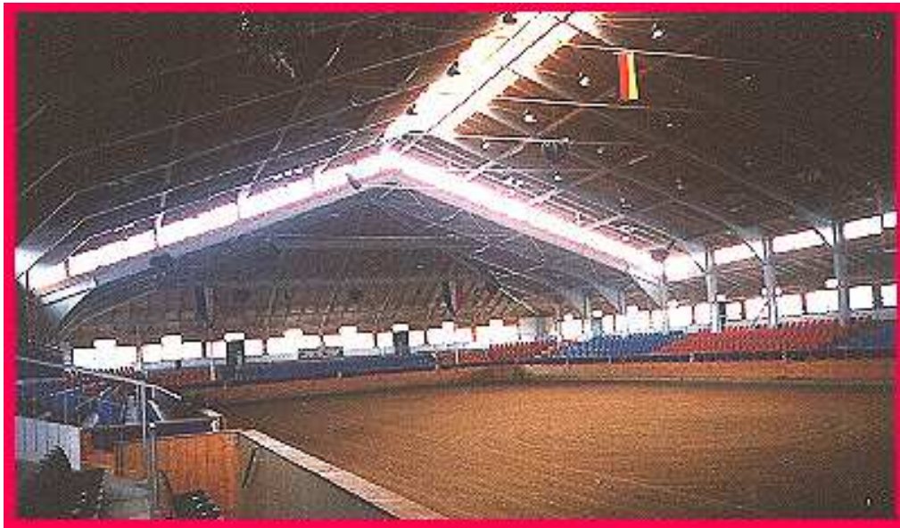
Außen- und Innenansichten der "Graf-von-Lindenau-Halle" des Reit- und Veranstaltungszentrums von Neustadt/Dosse

Gut durchdachte und konsequent ausgeführte Maßnahmen machten ihn zum Begründer der preußischen Landespferdezucht , wobei die geregelte und gelenkte Landesbeschälung der Stuten mit staatlichen Hengsten von entscheidender Bedeutung war. Später, 1831, schreibt er 76jährig das höchst interessante Buch "Bemerkungen eines Veteranen über edle Pferde", in dem er sich mit nicht annehmbaren Auffassungen über Pferde und Pferdezucht auseinandersetzt.